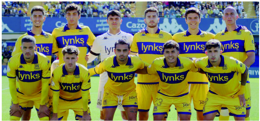
Alineación del Alcorcón de la pasada temporada