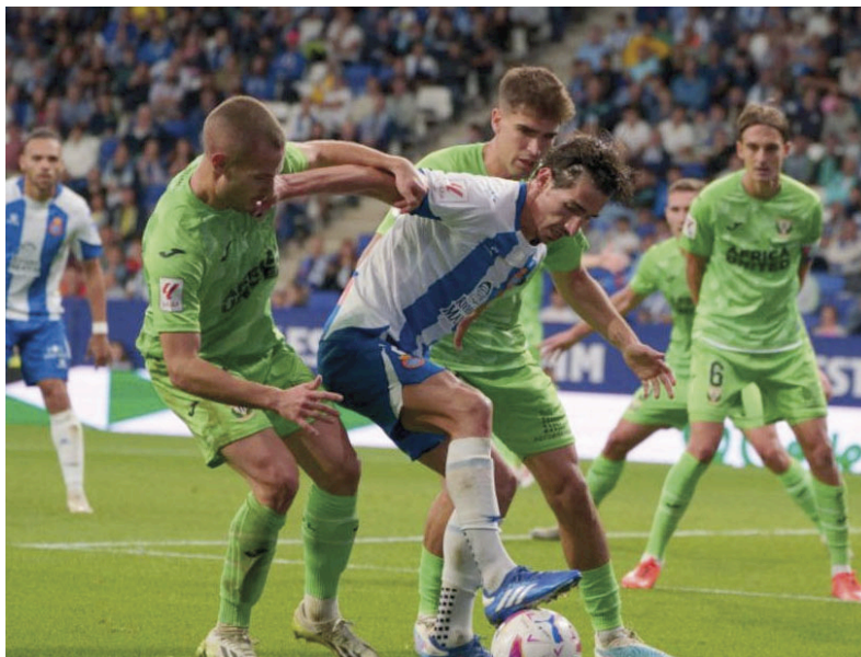
El Leganés ganó al Español en su feudo y le quitó el liderato.