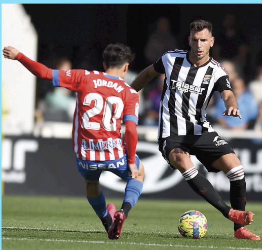
Imagen del último triunfo en el Cartagonova

El 22 de abril, el Efesé derrotaba al Sporting de Gijón, ha sido la última victoria albinegra en el Cartagonova, puesto que acabó la liga con un empate sin goles contra el Burgos de Calero y la amplia derrota (1-4) contra Las Palmas. Tras ganar a los asturianos, los de Carrión dilapidaron sus opciones de play off, pues no pasó del empate ante un Albacete en inferioridad y perdieron en Zaragoza (2-0) y Santander (3-1). Hasta la victoria en Villarreal (1-2) pasaron cuatro meses y ocho partidos sin ganar. Tras el triunfo en la Cerámica, la racha es aún peor, con nueve encuentros sin arrostrarse un triunfo. Lo que significa que, en medio año, el Fútbol Club Cartagena solo ha ganado un partido. Por contra ha perdido un total de 11 y empató, 5. Unos números alarmantes, y lo que es peor es que no tiene visos de mejorar lo suficiente, como para huir del atolladero en el que anda sumido. La esperanza es que aún quedan dos tercios de competición y la opción de mejorar una plantilla, que deja mucho de desear, en el mercado invernal.