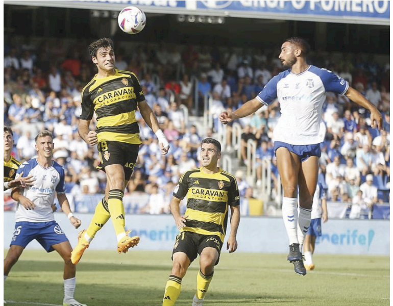
Valiosa victoria maña en Tenerife / Real Zaragoza