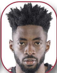
ETEKI 1 Temporada 10 p. / 0 g. Casa Pía