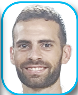
HEVEL Países Bajos (27) FC Andorra