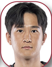
LEE 1 Temporada 1 p. / 0 g. ¿?