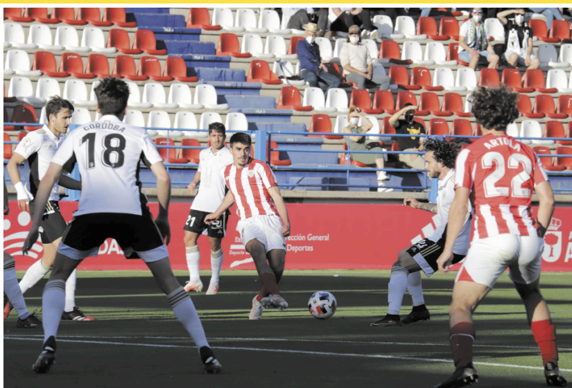
Imagen del partido entre el Burgos y el Bilbao Athletic para el ascenso.