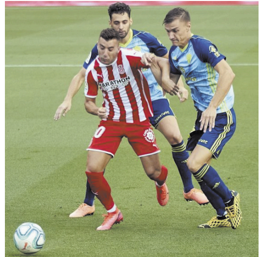
Partido de ida del play off de ascenso en Girona.