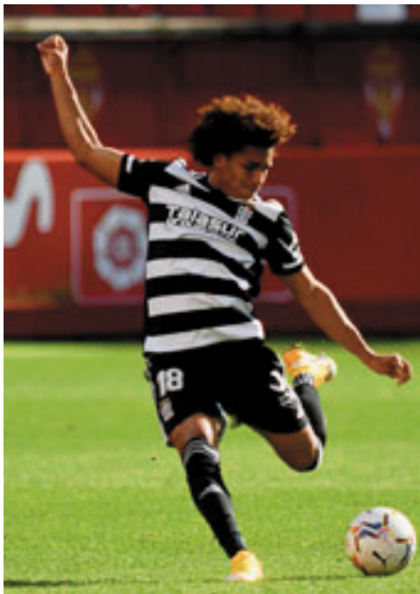
En Oviedo, Borja Jiménez lo puso en el once inicial, pero lo sustituyó en el descanso. Luis Carrión lo mantuvo hasta el final

Con el debut de las seis incorporaciones, ya son 32 los jugadores que han actuado en lo que va de competición y eso que Esteve y Kleandro están inéditos, tanto en Liga como en Copa. Junto al Málaga es el que más jugadores han utilizado, sobre un total de 615. La media en la Liga2 es de 28 por equipo y los que menos futbolistas han puesto en escena son el Sporting, 24 y Ponferradina, 25. En cuanto a las demarcaciones, señalar que hay equipos que solo han utilizado un guardameta. Y en el otro extremo está el Logroñés que por diversas circunstancias, especialmente lesiones ya ha utilizado cinco porteros, todo un récord. En el Cartagena con cuatro en el plantel, dispuso de tres para los 23 partidos.