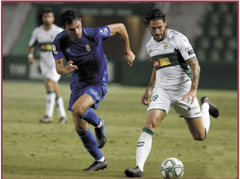
El Real Oviedo cerró la liga pasada contra el Elche.